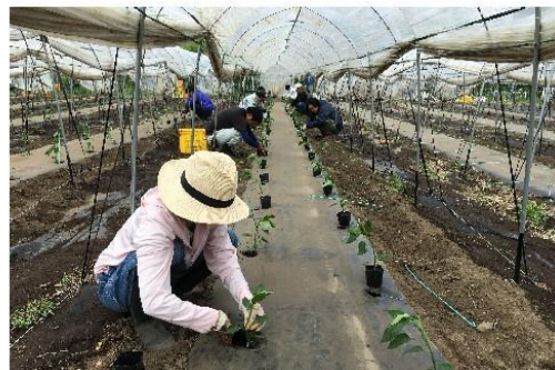
ピーマンの定植作業