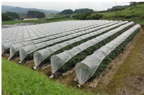
ピーマンのミニハウス(間口1.8m)