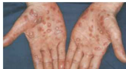
日本性感染症学会