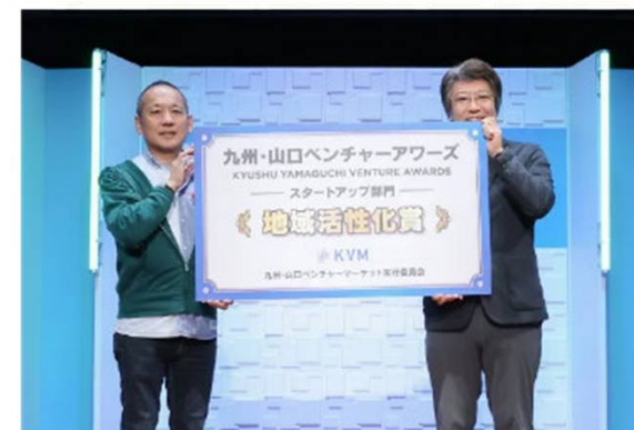
株式会社おおいたCELEENA（大分）