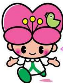
大分県人権啓発イメージキャラクター こころちゃん

こころちゃんの部屋においてよ！ こころちゃんの部屋 で検索 https://www.pref.oita.jp/site/kokoro/list21218-24061.html