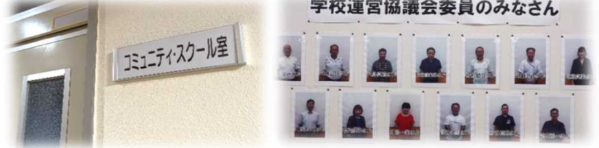
■ 玖珠町立くす星翔中学校のCSルーム