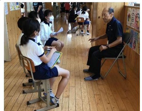
【6年国語 SAさんにインタビュー】