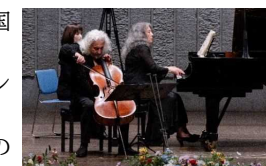
別府アルゲリッチ音楽祭