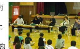
文化キャラバンによる鑑賞機会の提供