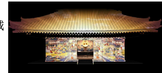
富貴寺大堂の実物大模型にCG映像を投影する様子(県立歴史博物館)