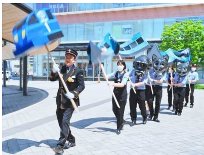
県立美術館とJR大分駅との共同企画「JR九州と行こうプロジェクト『どこでも駅(えき)』」