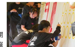
新生支援学校生と大分雄城台高校生による交流発表会