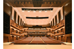
iichikoグランシアタ (大分県立総合文化センター)