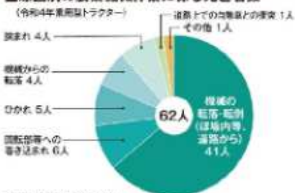
■原因別の農業機械作業に係る死亡者数