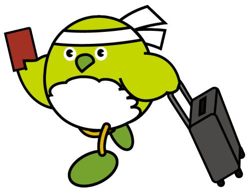
中津市 檜原山展望所