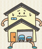
バランスの悪い家