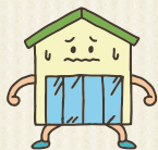
1階に壁の少ない家