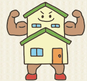
バランスの良い家