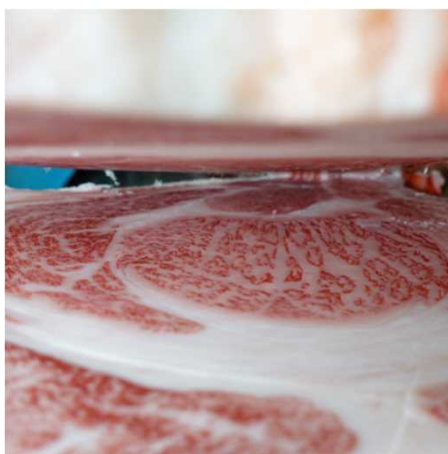
(株)大分県畜産公社 検定番号4