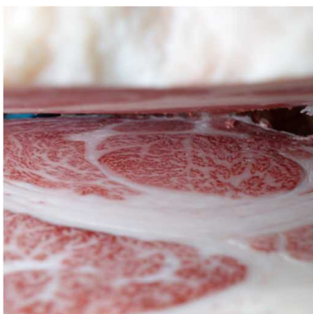
(株)大分県畜産公社 検定番号5