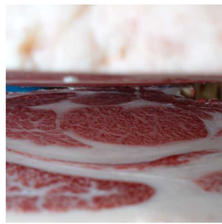
(株)大分県畜産公社 検定番号1