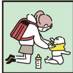
家族に代わり、幼いきょうだいの世話をしている。