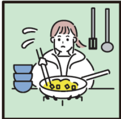
障がいや病気のある家族に代わり、買い物・料理・掃除・洗濯などの家事をしている。

ヤングケアラーを支援につなぐにあたっては、本人の意思を尊重すること、本人や家族の想いを第一に考えることが重要です。本人や家族との対話の中で緊急性を確認した上で、信頼関係を築きながら状況の把握をお願いします。