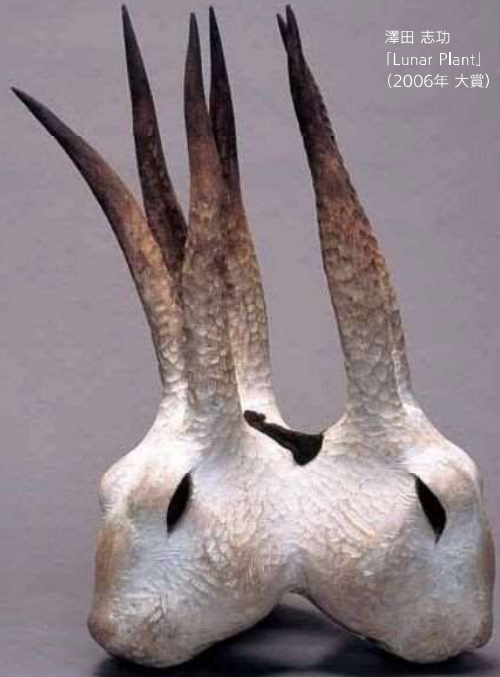
澤田 志功 「Lunar Plant」 (2006年 大賞)