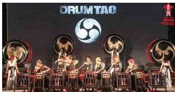
「東京タワーレッドライトアップ」の点灯式で生配信されたDRUM TAOによる和太鼓パフォーマンス