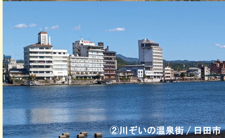
② 川ぞいの温泉街 / 日田市