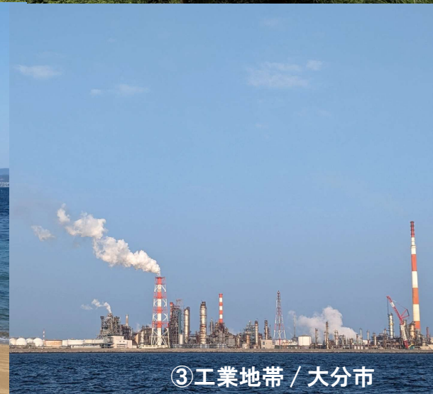
③ 工業地帯 / 大分市