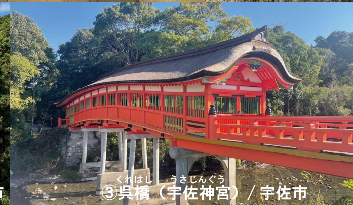
くれはし うさじんぐう ③ 呉橋 (宇佐神宮) / 宇佐市