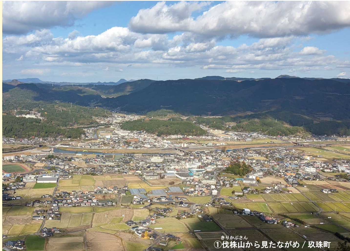
きりかぶさん ① 伐株山から見たながめ / 玖珠町