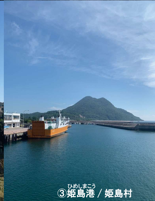
ひめしまこう ③姫島港 / 姫島村