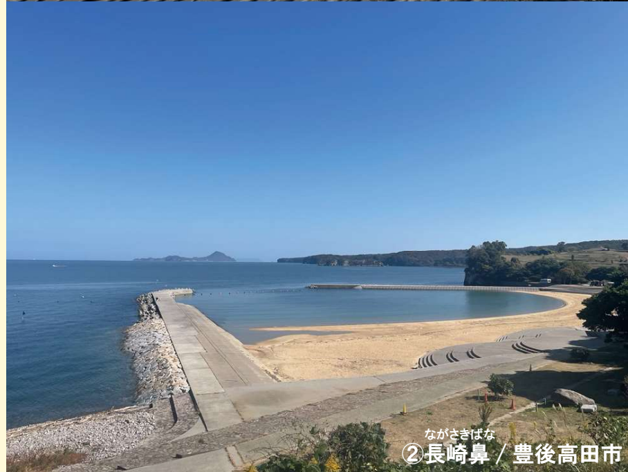
ながさきはな ②長崎鼻 / 豊後高田市