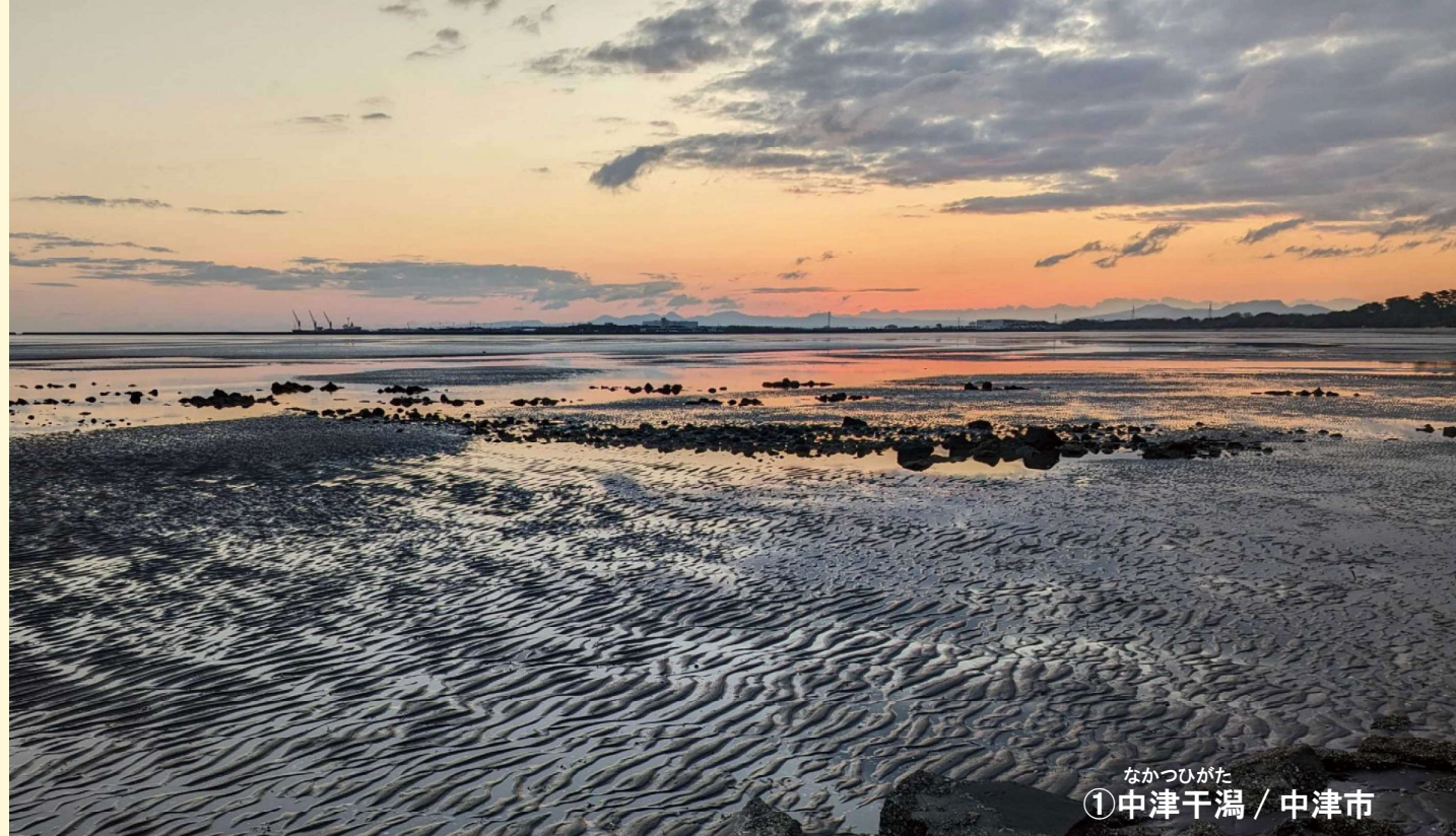
なかつし ①中津干潟 / 中津市