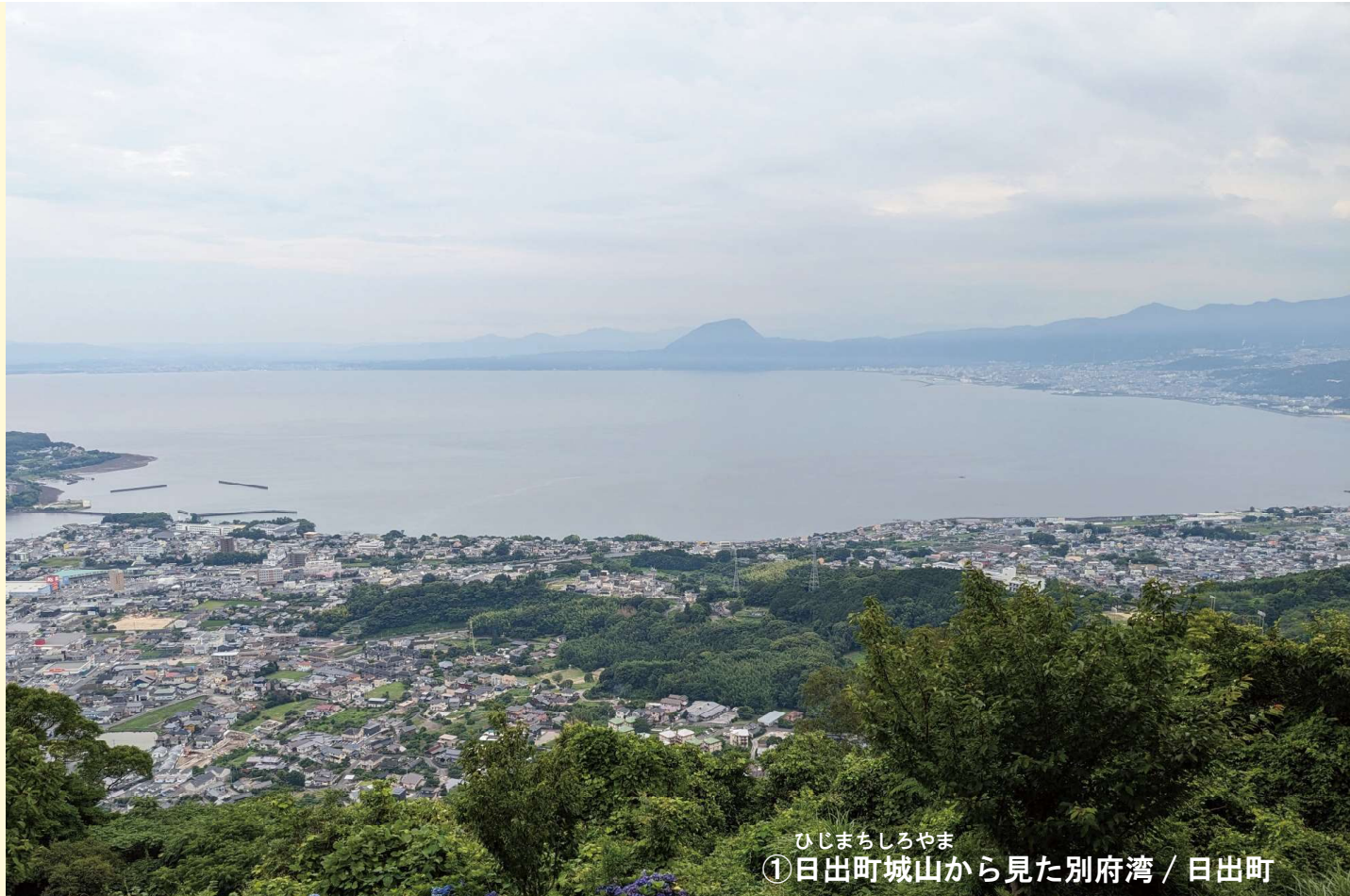
ひじまちしろやま ① 日出町城山から見た別府湾 / 日出町