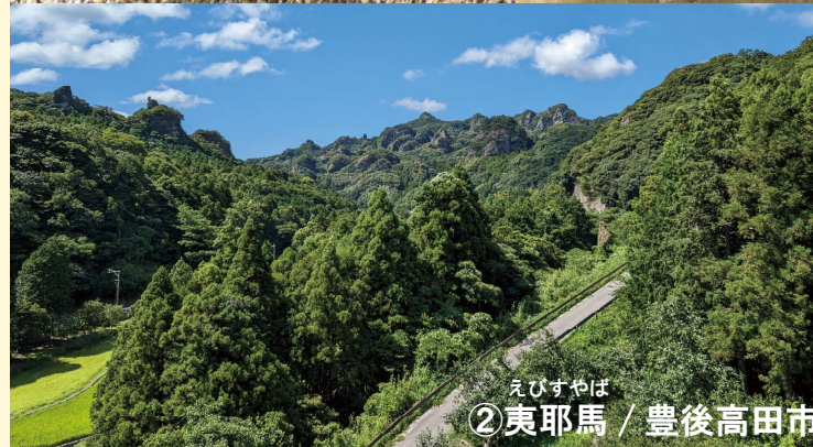
えびすやば ② 夷耶馬 / 豊後高田市