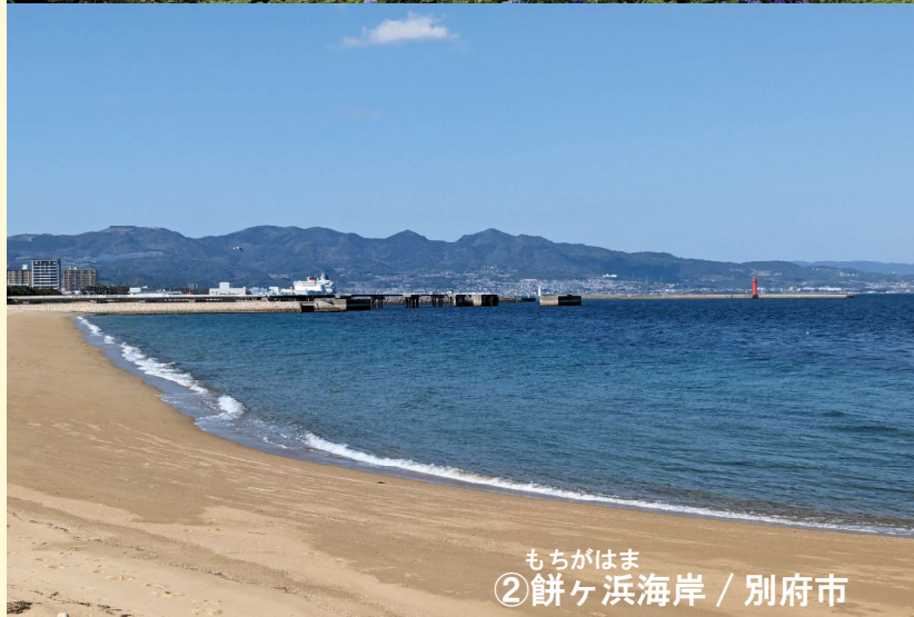
もちがはま ② 餅ヶ浜海岸 / 別府市