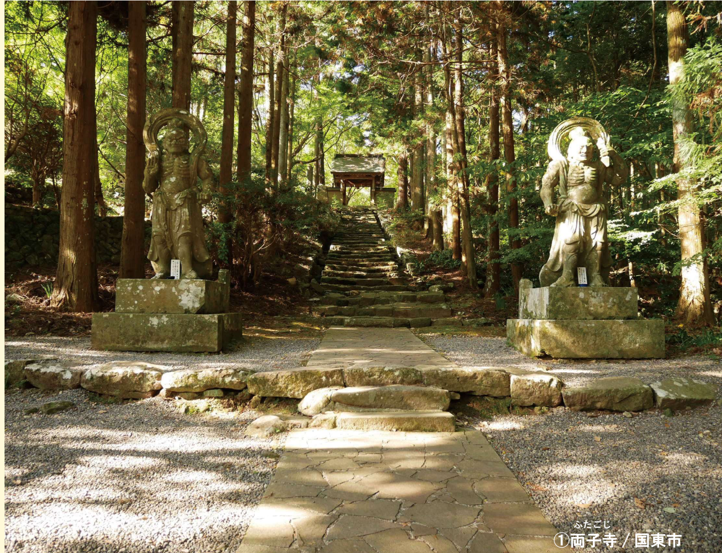
ふたごじ ① 両子寺 / 国東市