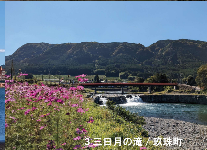
③ 三日月の滝 / 玖珠町