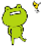
九州ろうきん イメージキャラクター 『ツカエルさん』