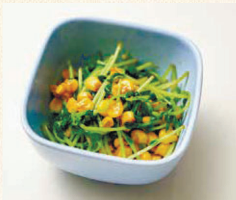
レシピ提供:公益社団法人 大分県栄養士会