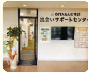
大分市高砂町にあるセンター

さらに、人工知能(AI)を活用したマッチングシステムも導入し、事前の価値観診断テストに答えると、AIがおすすすめのお相手を紹介してくれます。