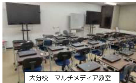
大分校 マルチメディア教室