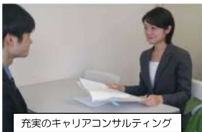
充実のキャリアコンサルティング