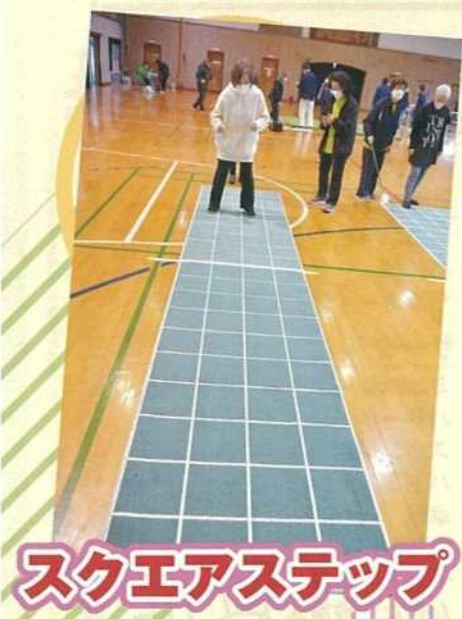
スクエアステップ