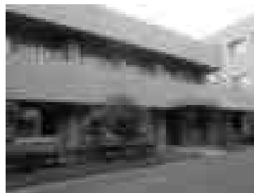
感染症専用病棟 三養院(6床)