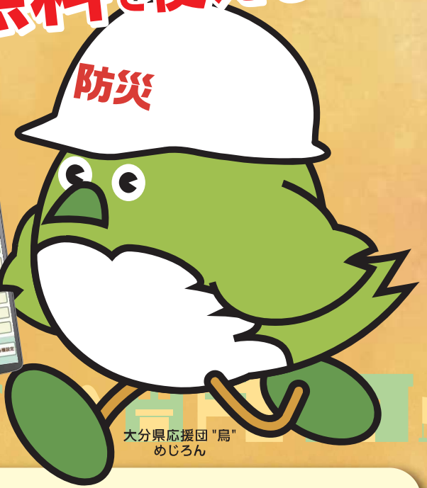
大分県応援団「鳥」めじろん