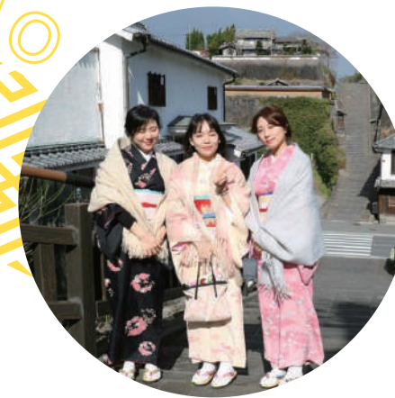
穿著和服在杵築市等美麗的古樸城鎮裡漫步遊覽。拍攝紀念照片留下美好的回憶。