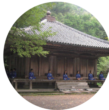
在九州最古老的木造建築物國寶富貴寺大堂體驗短時間坐禪。