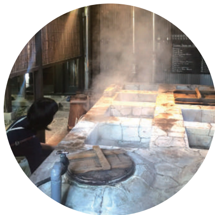
攝氏98度的熾熱蒸氣震撼力滿點。一整天都冒著熱騰騰的溫泉蒸氣。