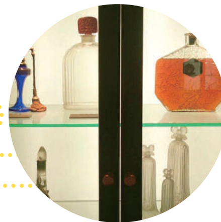
在藝廊裡展示著珍貴的香水、香水瓶等豐富的展示品。