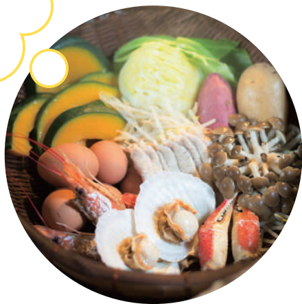
利用溫泉蒸氣的「地獄蒸料理」是鐵輪溫泉從江戶時代開始持續至今的烹調法。