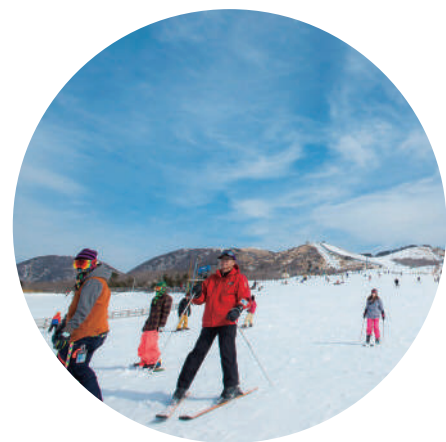
在九州最大的「九重滑雪場」體驗滑雪。這座滑雪場讓初學者也能放心。