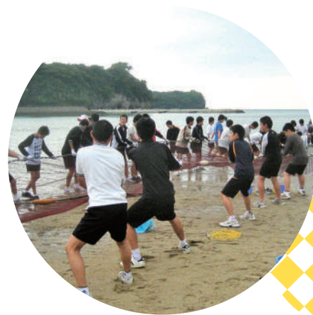
在擁有許多谷灣的大分縣、體驗曳地網！