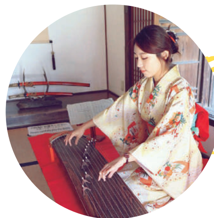
優雅的「和服」租借活動廣受好評。在豐富多樣的款式中自由挑選喜愛的和服。