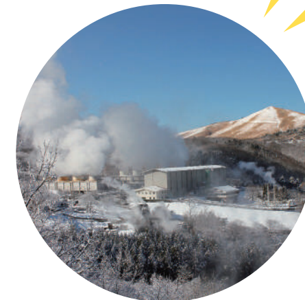
運用地下岩盤蒸氣發電的「八丁原地熱發電所」是近來受到矚目的新世代能源。