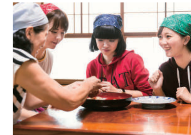
鄉土料理製作體驗