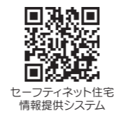
セーフティネット住宅情報提供システム