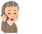
電話による安否確認

【契約料金の例】 2,000~8,840円/月 民間事業者(居住支援法人など)、警備会社、郵便局などが定期的に直接訪問