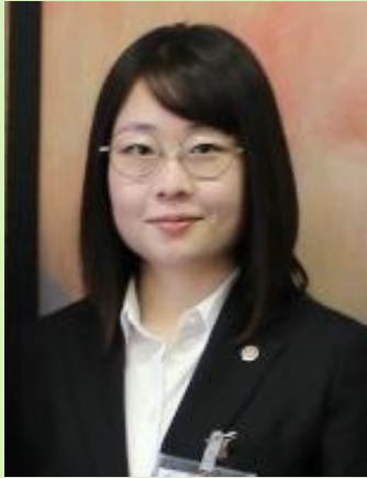
JICA青年海外协力队员