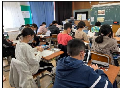
NO.573 2022年12月 大分市立寒田小学校

算数の問題を実際にやってみるとイメージがつかめる。みんなで楽しく学ぶから、理解も深まる。