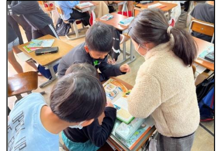
NO.572 2022年12月 大分市立寒田小学校

自分で調べて考える。それぞれの考えを出し合う。そして、また個人で考える。繰り返すことで学びが深まる。