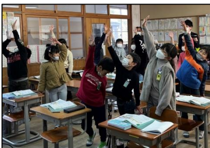
NO.571 2022年12月 大分市立寒田小学校