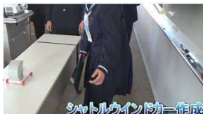
シャトルウインドカー作成