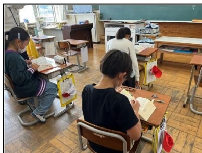
NO.394 2022年11月 大分市立上戸次小学校