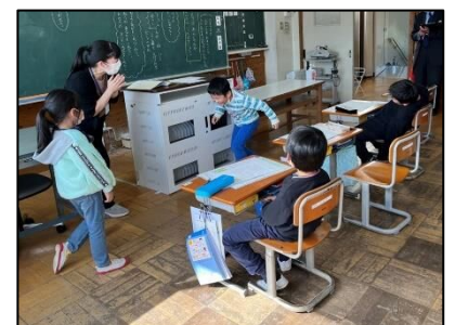
NO.395 2022年11月 大分市立上戸次小学校

同じ言葉でも、辞書によって表記は異なる。それぞれの表し方を知ると、学びが深くなる。