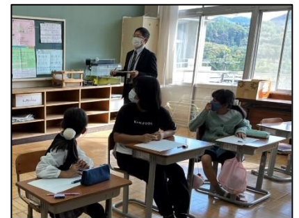
NO.396 2022年11月 大分市立上戸次小学校

腕が伸びる。指先まで集中する。自然に顔が上がり、背筋も伸びている。やる気が伝わる!