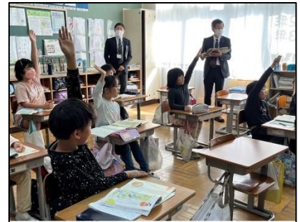
NO.398 2022年11月 大分市立上戸次小学校

また、学び合いも積極的に取り入れ、子ども達の学びも深まっているように思いました。そのような学び合いを行う際の教師の立ち位置については、より俯瞰的に見ることで、それぞれの学び合いの様子を評価し、次への活動に活かされるとよいと感じました。