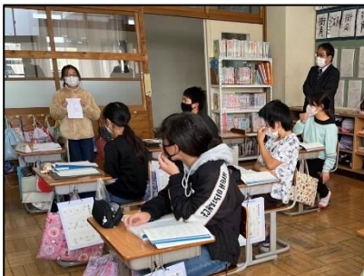
NO.397 2022年11月 大分市立上戸次小学校

困ったときは、前時までに学んだ事をふりかえる。前時までの形にすれば、この問題は解けそうだ。