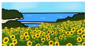
長崎鼻ひまわり畑