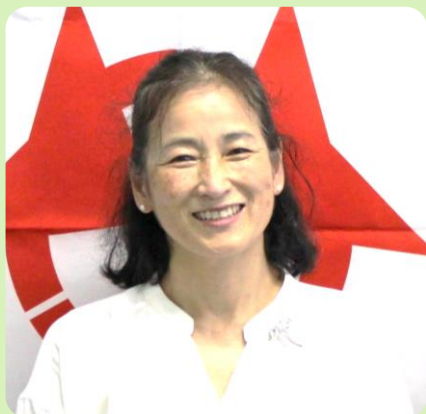
日语伙伴派遣项目 印度尼西亚 17期 大分县推荐项目派遣者