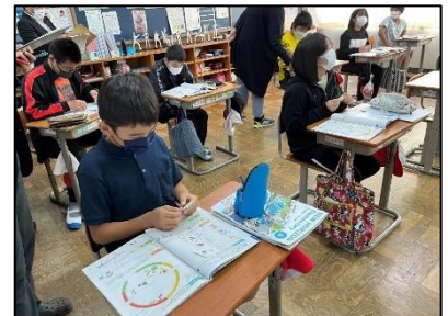
NO.274 2022年10月 大分市立竹中小学校