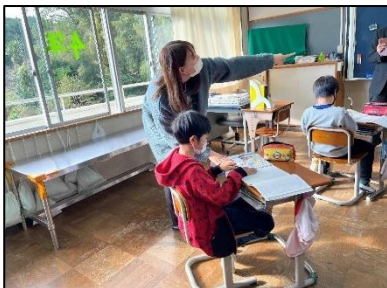
NO.271 2022年10月 大分市立竹中小学校

参観した全学級において、本校が取り組んでいる「自分の考えを发表或し、自分の考えを言葉で表現したりする場」が設定されていました。特に、1年生のペア学習はとても効果的だと感じました。今後は、子どもどうしの学び合いを取り入れることで、挙手する子どもだけでなく全員が説明に参加できるような工夫をされると良いと思います。その際は、教師は全体を俯瞰的に見ることで、それぞれのグループの良さや進捗について形成的な評価を行い、次への活動につなげると良いと思いました。