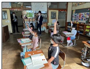
NO.276 2022年10月 大分市立竹中小学校