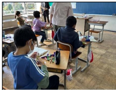
NO.273 2022年10月 大分市立竹中小学校

友達の発言と、自分の考えを比較する。共通点やちがいがみえてくる。だから、成長する。