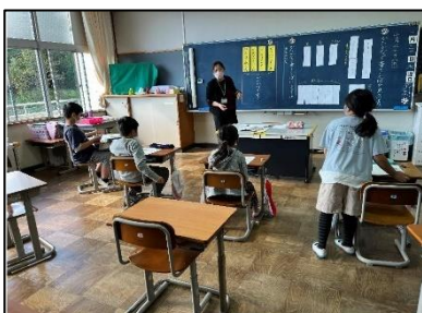
NO.275 2022年10月 大分市立竹中小学校