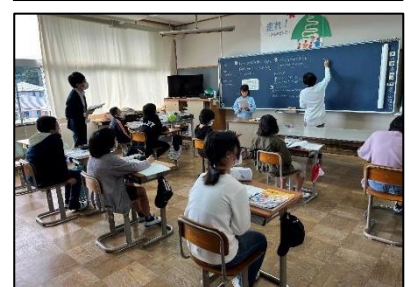
NO.272 2022年10月 大分市立竹中小学校