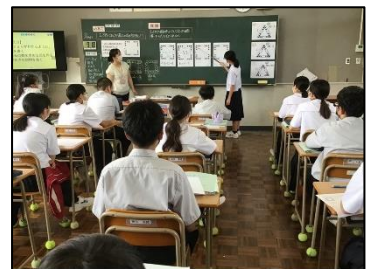
NO.105 2022年9月 臼杵市立西中学校

みんなで考えを出しあったら、それらを繋げる人。整理する人。そして書く人。それを見守る人。