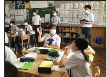
NO.106 2022年9月 臼杵市立西中学校

タブレットにそれぞれ自分の考えをまとめているから、交流がすぐにできる。意見が言える。