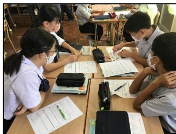
NO.104 2022年9月 臼杵市立西中学校

なお、「第2回地域授業改善協議会」を令和4年10月28日(金)に本校で開催します。組織的な授業改善を継続的、発展的に研究し続けた本校の実践を、生徒の変容を通して学ぶことができます。ぜひお越し下さい。