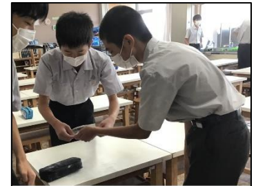
NO.107 2022年9月 臼杵市立西中学校