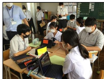
NO.103 2022年9月 臼杵市立西中学校

熱心に聞いてくれる友達がいる。見守ってくれる先生がいる。安心な教室だから前に出られる