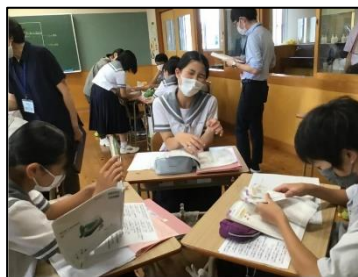
NO.98 2022年9月 臼杵市立北中学校