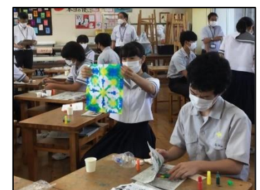
NO.96 2022年9月 臼杵市立北中学校

プレー以外にも共に協力するから、気持ちが通じるようになる。だから、パスもつながる。