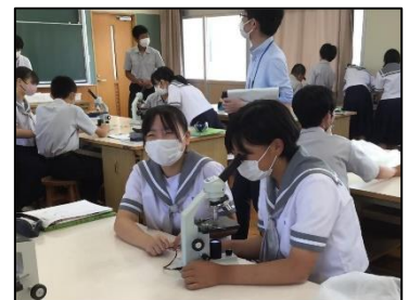
NO.97 2022年9月 臼杵市立北中学校