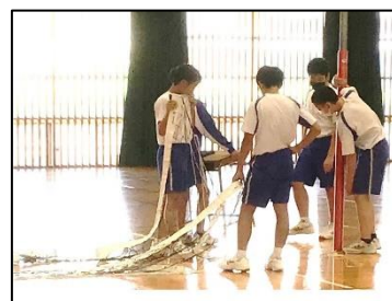
NO.99 2022年9月 臼杵市立北中学校