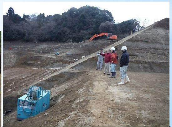
工事状況を地元の関係者と確認 (関係者との信頼関係は重要！)