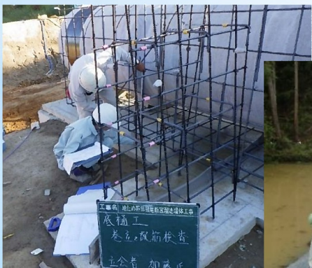
現場が設計書どおりできているかの確認！