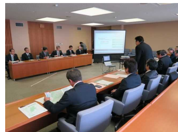
平成29年1月24日（火） 長野県観光機構 ○台湾からの訪日教育旅行について調査