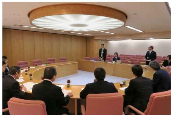
平成29年1月23日（月） 神奈川県庁 ○行財政改革とスマート県庁の取組を調査