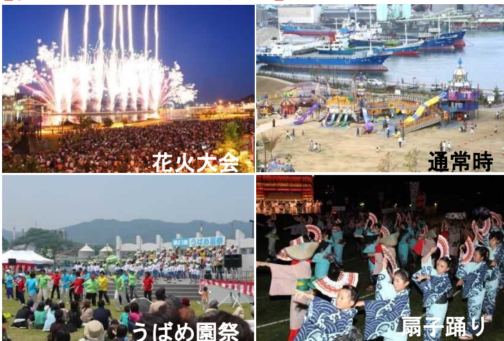
港湾緑地(つくみん公園)の集客数