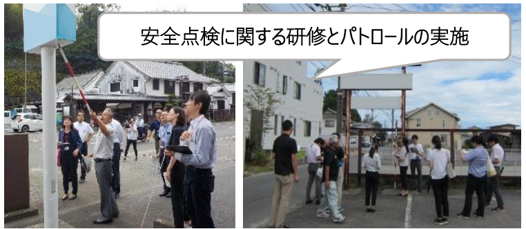
安全点検に関する研修とパトロールの実施

屋外広告物制度や安全点検のポイントについて研修しました！ また、大分県広告美術協同組合の協力のもと、街中に設置された看板の安全点検を実施しました！