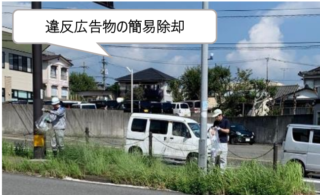
違反広告物の簡易除却

県や市では、9月1日～10日の屋外広告物適正化旬間を中心に、屋外広告物適正化のための取組を実施しました。