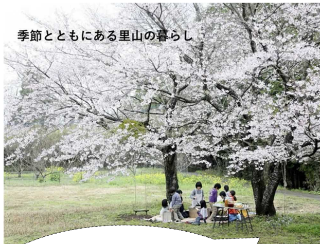
季節とともにある里山の暮らし