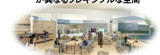
図書館空間と連携機能が一体的につながり、賑わいを生む