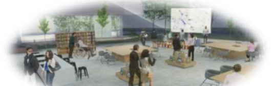
時間帯に応じて利用者や使い方が異なるフレキシブルな空間