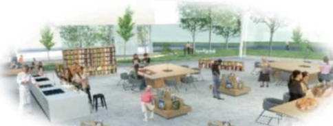
本の知識をもとに様々なトライアルやイベントが可能な連携機能