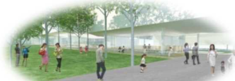
別府公園とつながる新図書館