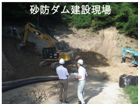
砂防ダム建設現場