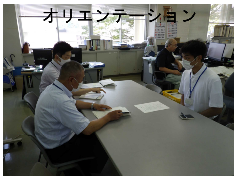
オリエンテーション