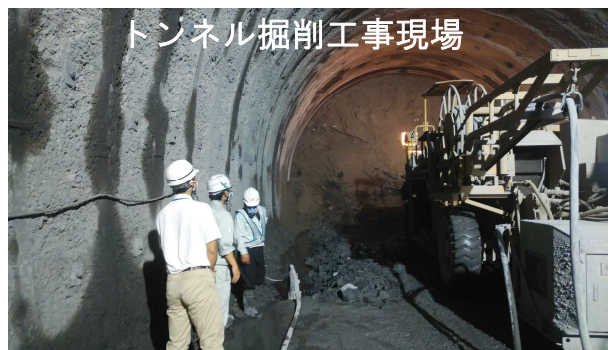
トンネル掘削工事現場