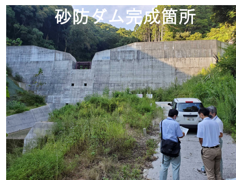
砂防ダム完成箇所