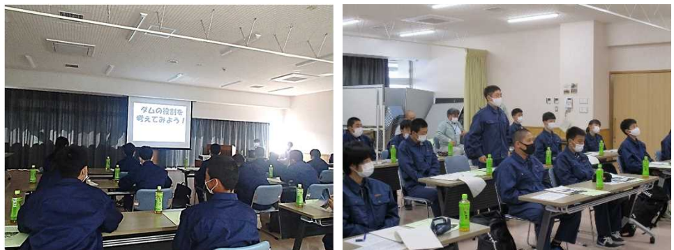
国東総合庁舎 301会議室