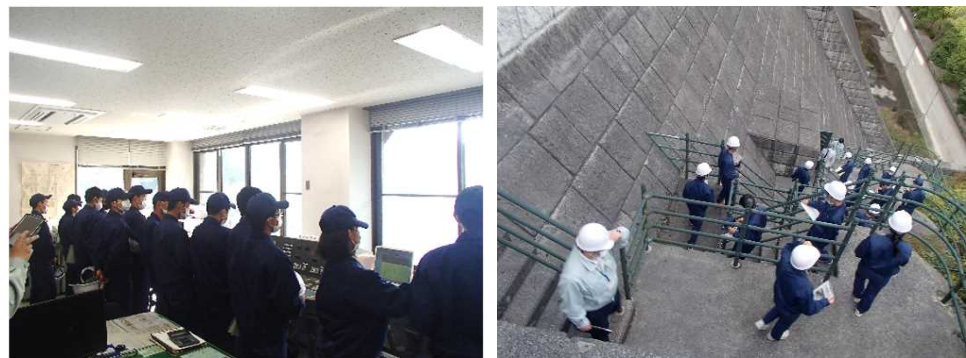
行入ダム(国東町横手)