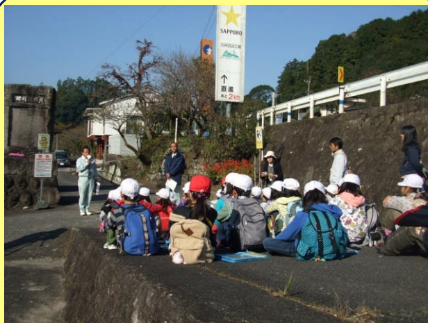
玖珠川取水口にて井路について復習と 取水量などの説明がありました。