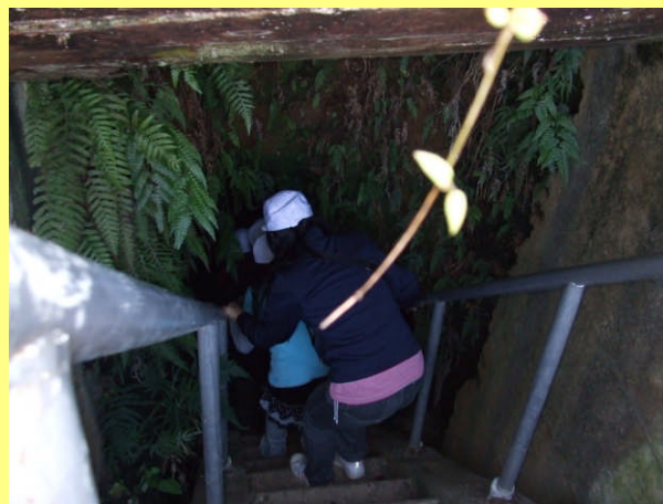
分水地点の見学のため地下へ潜入！ ライトを持って探検気分でした！