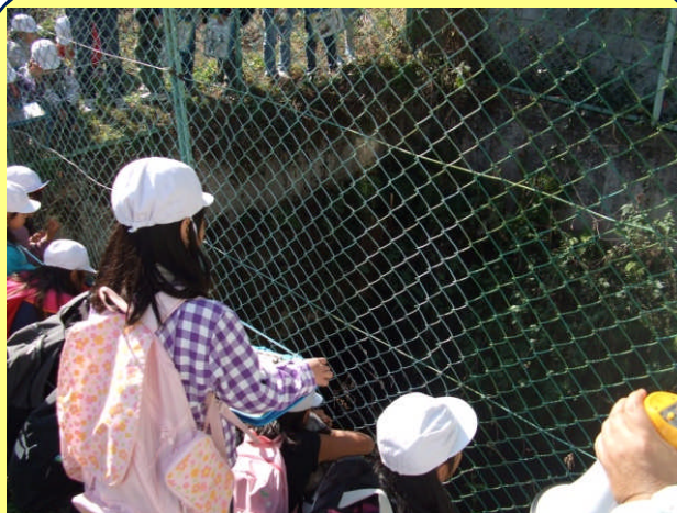
隧道区間唯一の開渠部を見学！ 当時の石積みを見ることができました。