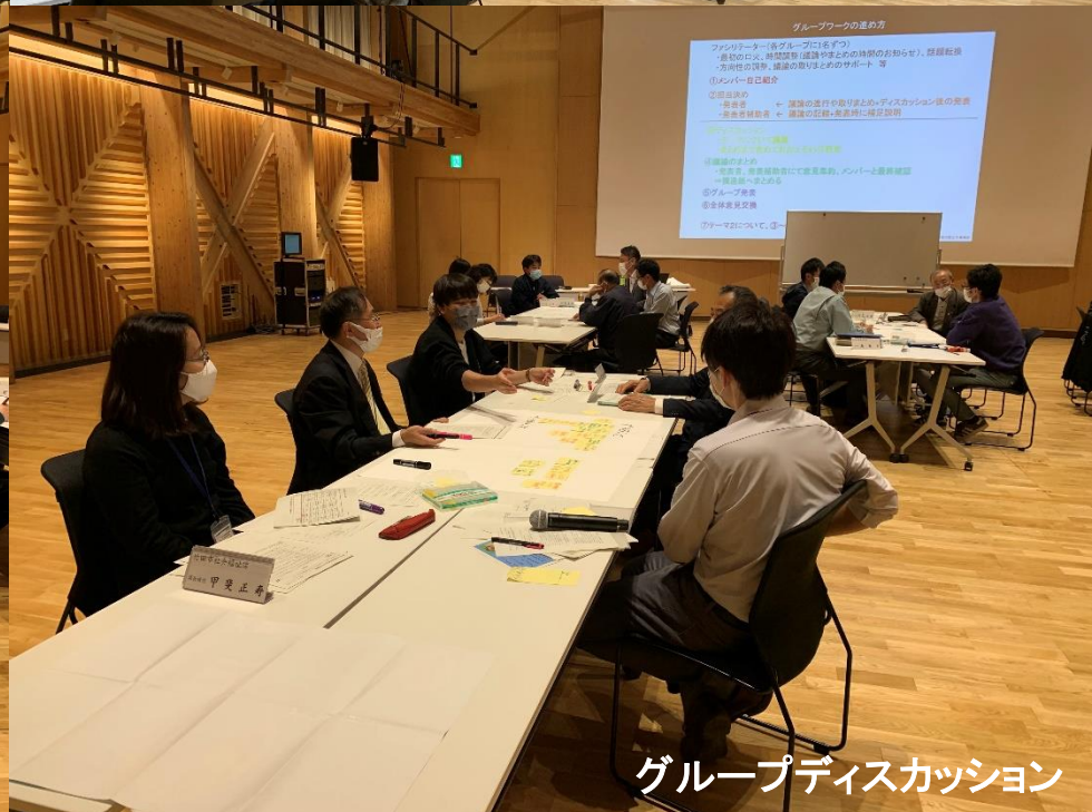
グループディスカッション