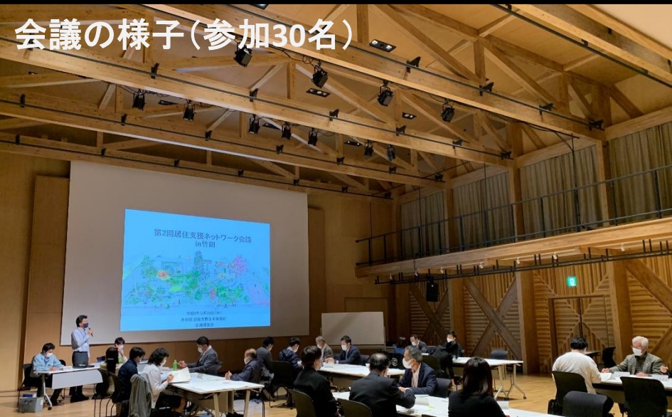
会議の様子(参加30名)