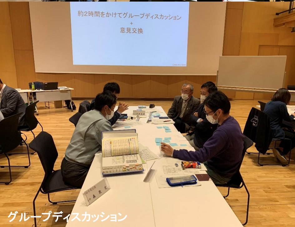
グループディスカッション