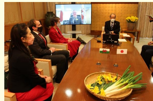
↑リーキとダフォディルで彩られた締結式会場