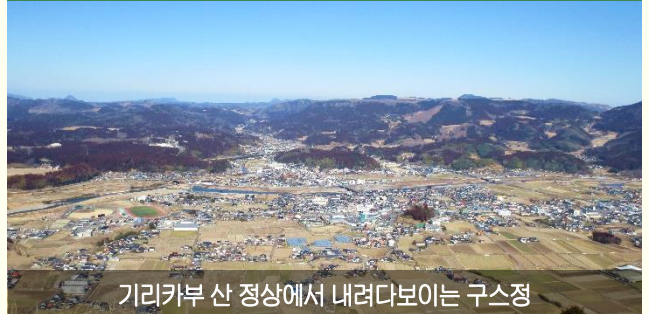
기리카부 산 정상에서 내려다보이는 구스정

옛날 옛적에 거인이 하늘까지 뻗어있던 녹나무를 잘랐더니 그루터기(기리카부)모양의 산이 되었다는 전설의 장소!