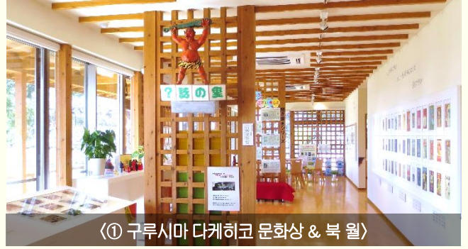
① 구루시마 다케히코 문화상 & 북 월

IC 교차로에서 일본 모모타로(桃太郎) 설화에 등장하는 새빨간 거대 오니(鬼, 일본 도깨비)를, 도로 휴게소(SA)에서 모모타로를 만날 수 있는 이곳은 오이타현 중서부에 위치한 구스정(玖珠町)이다. 별칭 ‘동화의 마을(童話の里)’인 이곳은 ‘일본의 안데르센’이라 불리는 교육자이자 동화구연가인 ‘구루시마 다케히코(久留島武彦)’의 출생지로도 알려져 있다. 1874년 구스정에서 태어난 구루시마는 아이들을 위해 동화구연을 하는 것이 자신의 사명이라 생각하며 ‘사람들과 함께 살아가는 데에 필요한 교훈’을 동화에 담아 아이들에게 재미있고 유쾌하게 들려주었다. ‘대머리’ 등의 우스꽝스러운 키워드를 활용하여 아이들의 눈높이에 맞춘 동화구연을 일생을 바쳐 전국 각지에서 선보이다 생을 마감한 그의 업적을 기리고자, 구스정에서는 1950년부터 매년 5월 5일에 ‘일본 동화제(日本童話際)’를 개최하고 있다. 특히 길이 60m의 거대 고이노보리(こいのぼり, 어린이날 종이나 천으로 만든 잉어를 깃발처럼 장대에 다는 것)를 직접 통과할 수 있는 이벤트가 있어 동화제는 전국적으로 알려지게 되었지만, 정작 구스정이 왜 동화의 마을이라 불리는지, 구루시마는 누구인지는 잊혀져 갔다. 이를 안타깝게 생각한 초대 기념관장이 구루시마를 알리고자 노력했고 그 결실은 ‘구루시마 다케히코 기념관 개관(2017)’이라는 형태로 맺어지게 되었다.