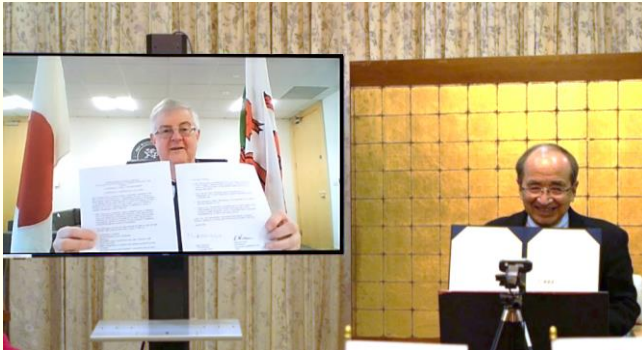
왼쪽부터 마크 드레이크포드(Mark Drakeford) 웨일스 자치정부 수반, 히로세(広瀬) 오이타현지사