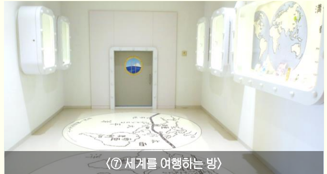
〈⑦ 세계를 여행하는 방〉

구루시마가 쓴 동화 10편과 구스정에 전해 내려오는 이야기를 구연동화로 재현하여 들려주는 방이다. 동화를 읽어 주는 목소리의 주인공은 녹음 당시 초등학생이었다고 하는데 매우 실감 나게 이야기를 들려 주고, 동화책의 삽화를 영상으로 보여 주어 더욱 생생하게 동화를 즐길 수 있다. 구루시마의 실제 목소리로 읽어주는 이야기도 들을 수 있다고 하니 그의 목소리가 궁금하다면 오랜만에 동심으로 돌아가 느긋하게 동화를 들여보길 추천한다.