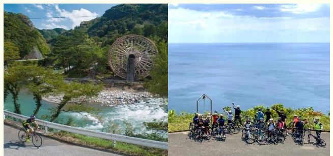
하늘 공원(좌), 혼조(本匠) 물레방아(우)

코스별로는 휴게 공간이나 관광 스폿이 달라 각 코스에만 있는 특별한 시설을 즐길 수도 있습니다. 자전거가 없는 분들도 즐길 수 있도록 렌탈 자전거, 스포츠 바이크, 전기 자전거, 2인용 자전거를 대여해 드리는 사이키에서 이번 봄에는 사이클링을 즐겨 보시면 어떨까요?