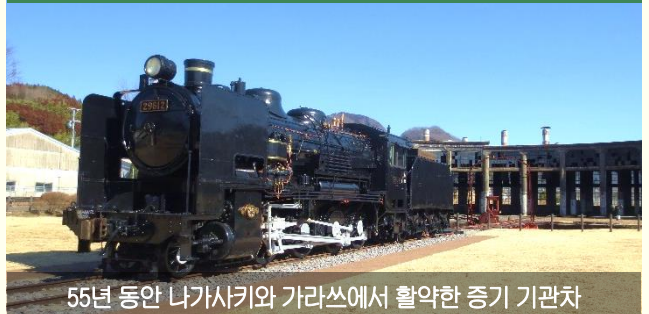
55년 동안 나가사키와 가라쓰에서 활약한 증기 기관차

규슈 유일 현존하는 라운드 하우스(선형 차고지)와 실물 증기 기관차가 있는 역사적 공간! 기관차고 박물관도 운영 중!