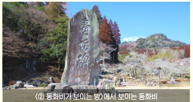
② 동화비가 보이는 방)에서 보이는 동화비

현재 기념관장은 한국인으로, 사전에 취재를 위해 방문한다고 말씀을 드린 덕에 시설에 대해 자세히 안내받을 수 있었다. 기념관 내부는 나무 기둥과 마루 인테리어로 전체적으로 따뜻하고 편안한 느낌을 주며 총 7개의 전시실 ‘방’과 아이들을 위한 공간, 기념품점 등을 갖추어 작지만 알차게 구성돼 있었다. 기념관에 들어서면 제일 먼저 구루시마의 그림이 두 팔 벌려 환영해 준다. 그 옆의 <북 월>에는 구루시마가 쓴 소설 680편 중 일부를 전시하고 있으며, 그중 10편은 동화책으로 출판되었다고 한다.