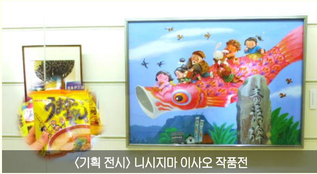
<기획 전시> 니시지마 이사오 작품전

에디터 : 노지영 (pu-no314@pref.oita.jp) 오이타현 기획진흥부 국제정책과 국제교류원