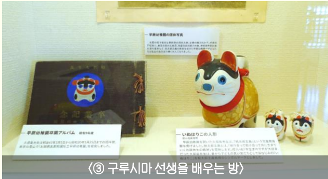
〈③ 구루시마 선생을 배우는 방〉

에디터 : 노지영 (pu-no314@pref.oita.jp) 오이타현 기획진흥부 국제정책과 국제교류원