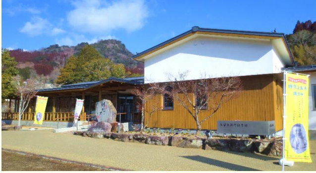
일본 안데르센의 업적을 기리고 미래로 잇는 곳 구루시마 다케히코 기념관 구스정

에디터 : 노지영 (pu-no314@pref.oita.jp) 오이타현 기획진흥부 국제정책과 국제교류원