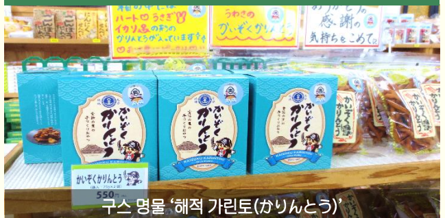
구스 명물 '해적 가린토(かりんとう)'

구루시마가 중세시대 해적 '무라카미 수군'의 후손인 점에 착안하여 이름 붙여진 달콤 바삭한 명물 과자도 판매 중!