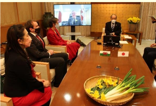
↑装饰着大葱和黄水仙的缔结仪式会场

在3月1日缔结MOU的当天，正逢威尔士的「圣·大卫日」（庆祝威尔士的守护圣人、圣大卫的节日）。为此我们准备了大分县出产的白大葱和黄水仙，来作为威尔士国花“大葱（西洋葱）”和“黄水仙”的替代迎接贵客的到来。