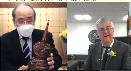
←德雷克福首席大臣与广濑知事在线上互换了纪念品

本次缔结仪式为了避免新冠病毒的传播，采取了线上和线下相结合的混合模式来举办。在仪式举办过程中，德雷克福主席表示：“非常希望能在近日到访大分县”。随着新冠疫情影响下的边境防疫措施不断放缓，首席大臣来访大分县的日子在不远的将来可能会真的实现。