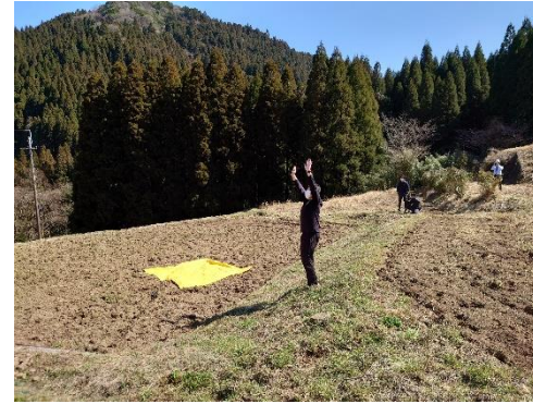
孤立地域でのサイン旗の掲示