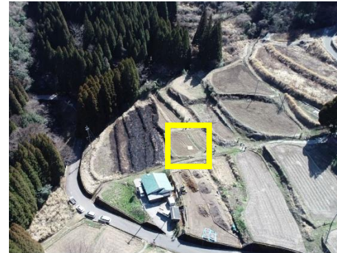
消防ドローンによるサイン旗の確認