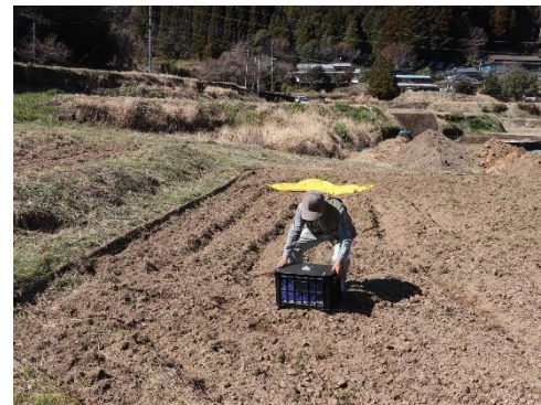
地元住民等による荷物受取