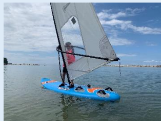
・マリンスクール