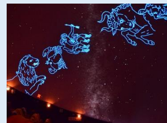
・プラネタリウム