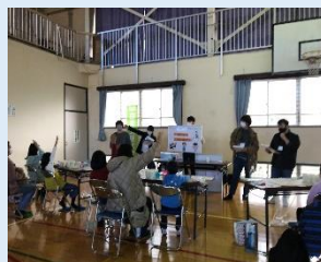
・ものづくり体験