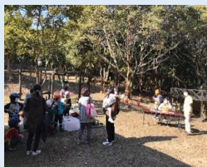
・森のフェスティバル