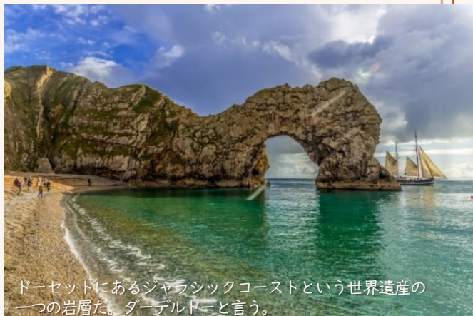
ドーセットにあるジャラシックコーストという世界遺産の一つの岩層だ。ダーデルドーと言う。