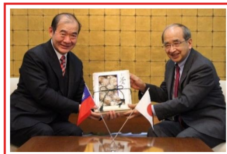
↑台湾で人気の大分県産乾しいたげを プレゼント ←左から鄭処長夫人、陳処長、 広瀬知事、李渉外課長

12月27日（月）、台北駐福岡経済文化弁事処の陳銘俊（ちんめいしゅん）処長と鄭靜敏（ていせいびん）処長夫人が大分県を訪れ、広瀬知事に表敬訪問を行いました。