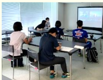
(사진) 선수단의 이야기를 집중해서 듣는 학생들.

코로나19로 선수단과 지역 주민과의 교류가 어려운 상황이지만, 이번 교류를 계기로 앞으로도 새로운 교류가 이어져 나가기 바랍니다.