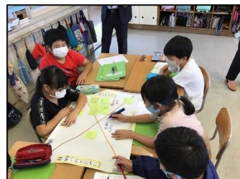
NO.379 2021年10月 由布市立谷小学校