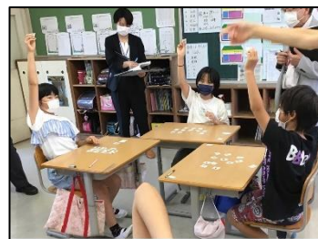
NO.380 2021年10月 由布市立谷小学校