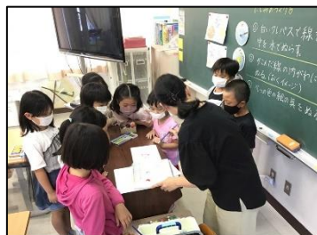
NO.378 2021年10月 由布市立谷小学校

また、本校の「振り返り」は「わがともや(写真参照)」とし、さらにタブレットを利用して「振り返りのデータ化」を行い、子どもの評価だけでなく授業者の反省にも生かしています。今後は、子ども達が何ができるようになった。どんな姿になったら良いのか等、教師が願う具体的なゴールの姿を「子どもを主語」とすることで、「ねらい」との連動や評価規準がより明確になると思いました。