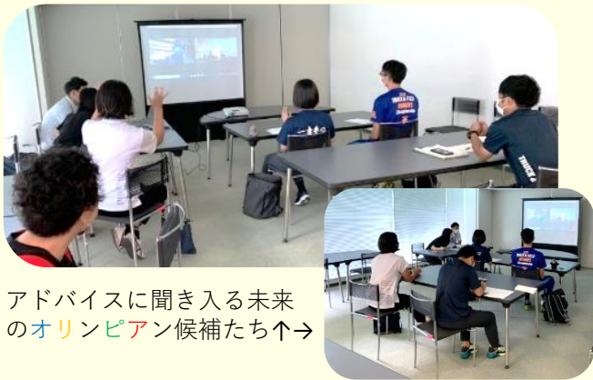
アドバイスに聞き入れる未来の オリンピ アン候補たち↑→

選手たちと地元の人との交流が思うように実施できない中、ポルトガル陸上代表の選手たちは、2021年のインターハイの陸上競技に出場する県代表の高校生12名とオンラインで交流し、高校生たちは普段の練習の映像を分析してもらい、身体の使い方などについてアドバイスをもらいました。