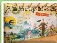
久留島武彦記念館