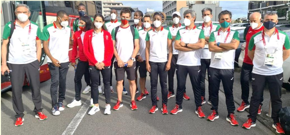
↑大分の地に降り立った、ポルトガル陸上代表の選手たち

令和3年7月23日（金・スポーツの日）、ついに東京2020オリンピックが開幕しました！