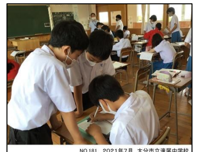
NO.181 2021年7月 大分市立滝尾中学校

私が学んだことを活かすことで、相手や周りの人を助けることになる。だから、学ぶのだ。