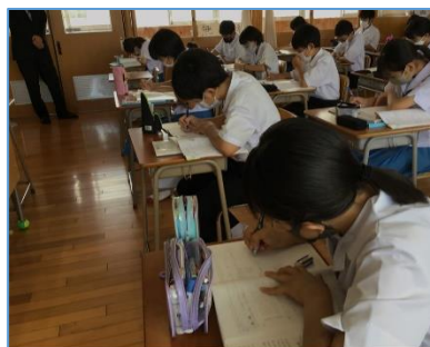
NO.180 2021年7月 大分市立滝尾中学校

参観した授業においては、落ち着いた雰囲気の中で、学びに向かう姿が見られ、短時間の学び合いが効果的に行われていました。今後は、公式のような既習の知識を問う場（絶対解）と、それぞれ生徒の思いが融合するような「納得解」を求める場における指導の在り方の違いや、個に応じた支援の方法をご検討されると良いかと思いました。